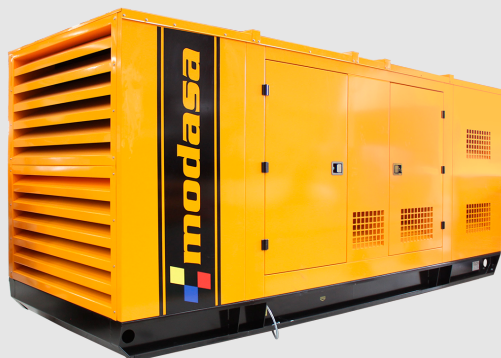
GRUPO ELECTRÓNICO INSONORO